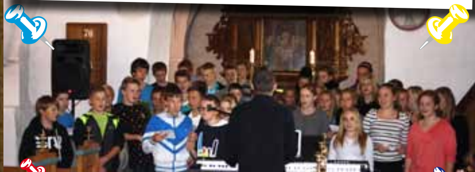
Asnæs sogns store konfirmandgospel kor på årets konfirmandlejr