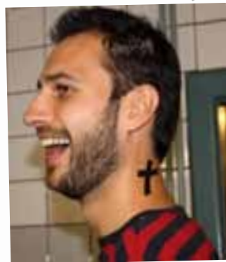
Både konfirmander, frivillige og præster blev tydeligt mærket.

I weekenden den 8. og 9. oktober drog vi af sted på lejr herfra Asnæs sogn – 50 konfirmander, seks frivillige fra menighedsrådet og sognets to præster. Konfirmandlejren blev afsluttet med en stor gospelgudstjeneste i Asnæs kirke søndag eftermiddag – hvor alle konfirmander tilsammen udgjorde det mægtige gospelkor. Kirken var fyldt til bristepunktet denne eftermiddag og den oplevelse disse unge mennesker sendte os kirkegængere hjem med, gav os ikke alene gospelsangens evangeliske håb – men også et skønt billede af, hvordan håbet gi'r den smukkeste lyd fra sig, når 50 unge lader deres stemme lyde i fællesskab!